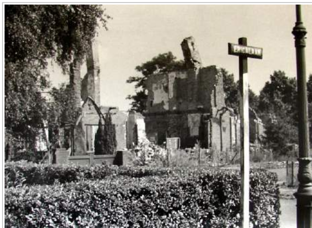
Ericaplein na het bombardement

Wageningen Monumentaal heeft samen met de historische vereniging Oud Wageningen het initiatief genomen om het vergissings-bombardement van de Geallieerden op de Sahara (1944) te herdenken. Het is de bedoeling om dat op 17 september 2019 te doen, samen met nabestaanden en andere geïnteresseerden. Daarbij wordt op het Ericaplein een sober monument geplaatst in de vorm van een zwerfkei met plaquette.