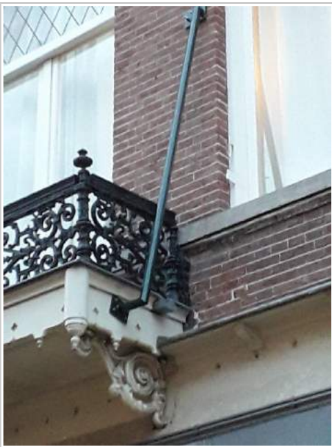
Hoogstraat 67-69, "aanpassing" van een gemeentelijk monument

Nog steeds zien we aanpassingen van monumenten, die niet vergund zijn. Voor elke wijziging van een monument is een vergunning nodig, waarbij een afweging moet plaats vinden of de wijziging past in het architectuurbeeld zoals beoogd bij de aanwijzing tot monument. Er zit bij de Commissie Ruimtelijke Kwaliteit (CRK), die B&W adviseert, voldoende deskundigheid. Maar toch gaat het nog wel eens mis. Sommige eigenaren weten gewoon niet, dat een wijziging moet worden aangevraagd, andere wagen de gok. Dan moet er gehandhaafd worden, op een melding bij de gemeente. Soms blijkt dat die wijziging er al heel lang zit - ga dan nog maar eens handhaven. Bijvoorbeeld zonnepanelen op een 17e eeuws pand, die er al tien jaar op zitten. Wat doe je dan? Een voorbeeld in de Hoogstraat laten we hierbij zien. Een fraai balkon aan een gemeentelijk monument, ondersteund door een ijzeren pijp, die niet vergund is en ook niet passend. Zeg nou zelf, kan dit?