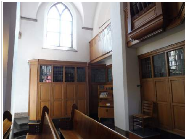
Wederopbouw-tochtportaal en scheidingswand van eikenhout

partijen hun standpunten uitgewisseld. Het gevolg was dat het plan in aanzienlijke mate werd bijgesteld, zodanig dat belangrijke delen van het wederopbouwinterieur werden gespaard. Na deze planwijziging hebben we besloten geen verdere stappen meer te ondernemen, zodat nu de restauratie en aanpassing van de kerk van start zijn gegaan.