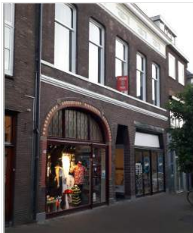
Bergstraat 18-20, linker deel reeds hersteld

Wageningen Monumentaal volgde het participatietraject voor de herontwikkeling van De Dreijen. Wij richtten ons vooral op het behoud en hergebruik van de gebouwen (zoals het Scheikundegebouw) en op het zichtbaar houden van de geschiedenis van de universiteit. In januari jl. heeft Ter Steege