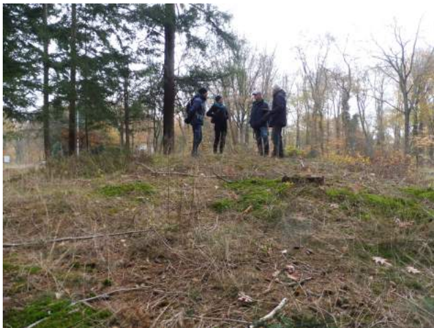
Nog ongeregistreerde grafheuvel

http://www.wikiwageningen750.nl/grafheuvels/#comment-40189