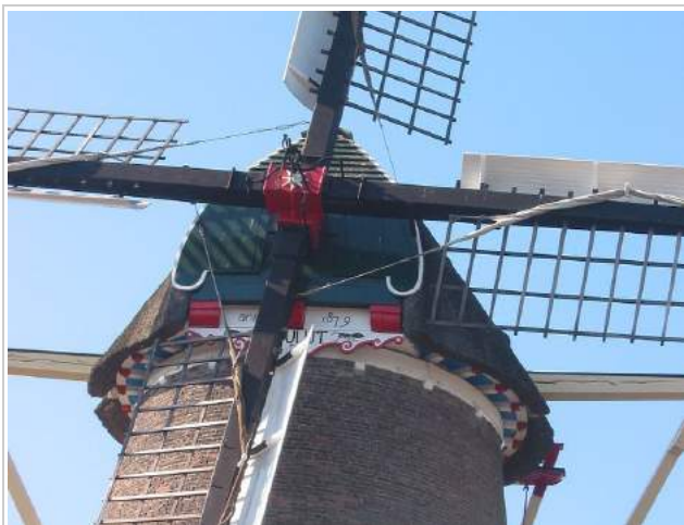
Molen de Vlijt

rekenregel voor maximale hoogte van gebouwen. Het is namelijk van groot belang dat de molen wind kan blijven vangen. Zonder of met te weinig wind kan de molen dan gewoon niet meer draaien. Bij De Vlijt is dit extra belangrijk, omdat de molen is een van de weinige molens in Nederland is, die nog commercieel succesvol draaien op wind. Een molen MOET blijven draaien, dat is het behoud van de molen, dan worden alle onderdelen regelmatig gecontroleerd en onderhouden.