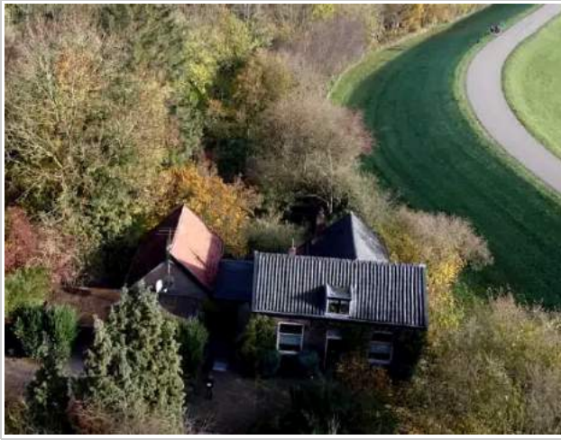
Grebbedijk 2 nu

versterken. Dit perceel is echter de locatie en de voortzetting van de zgn. Straelens hoff, een buiten dat al in 1650 op de kaart stond. "Hoff" duidt op een moestuin. Er lag ook een boomgaard, aan dezelfde zijde als tegenwoordig. Anton Zeven heeft er in het blad Oud Wageningen, jaargang 35 nr. (feb. 2007) uitvoerig over bericht. Het terrein was zelfs aanvankelijk omgracht. Het werd ook wel de Rietpol of 't Eylant genoemd. In 1570 blijkt er op de kaart van Van Deventer reeds een