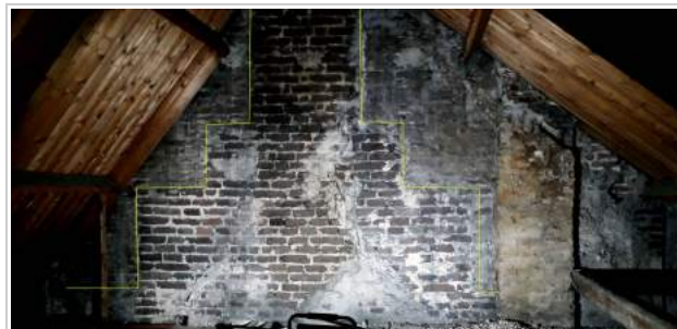
Trapgevel in de achtergevel van Hoogstraat 65

Opticien Bril29 gaat verhuizen naar Hoogstraat 65. Daar zat vroeger het Kruidvat in. Het pand is geen monument, maar uit nadere beschouwing blijkt dat dit pand tenminste deels een hoge ouderdom heeft. Dat is zelfs aan de buitenkant al te zien aan de zogenaamde Y-ankers. Dat zijn balk-ankers die tenminste wijzen op een 17e of zelfs 16e eeuwse herkomst. Het was op enig moment mogelijk om ook binnen te kijken, niet alleen in het voorhuis, maar ook het achterhuis. Daar zagen we sporen van een dichtgezette trapgevel en een sleutelstuk (zeer oude balkondersteuning). Aangezien het pand geen monument is, heeft de eigenaar alle mogelijkheden om zonder verder onderzoek en met het oog op het toekomstig gebruik te slopen en te vervangen wat nodig is. Dat zou betekenen dat ook die historische bouwelementen ongedocumenteerd kunnen verdwijnen. We hebben gepleit voor een bouwhistorisch onderzoek om te onderzoeken wat er nu precies aan oude bouwsporen te vinden is. Dat heeft ook plaats gehad dankzij de medewerking van de gemeente, de eigenaar en de architect van de eigenaar. De bouwhistorici van MAB stuiten op een goeddeels intact laat middeleeuws achterhuis met twee complete trapgevels (zie foto boven) en spantbenen met zgn. haalmerken en diverse balken met sleutelstukken uit de periode 1500-1600. Een dendrochronologisch onderzoek heeft plaatsgehad om de balken preciezer te dateren. Wij zullen ervoor pleiten om die historische delen zoveel mogelijk te