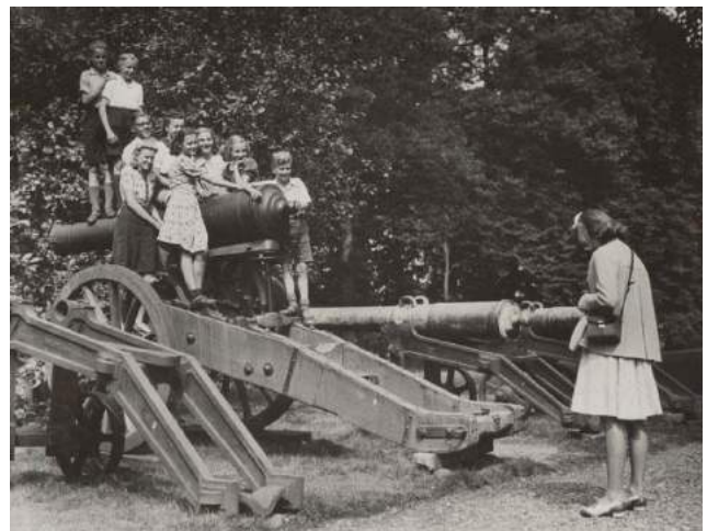
Rechts waarschijnlijk de 2 Wageningse kanonnen in Doorwerth

Het zou dus goed zijn als er meer informatie boven water zou kunnen komen over wat er met de stukken is gebeurd. We hebben hier ook al over gesproken met onze collega's van Oud-Wageningen, in de hoop dat daar kennis zou kunnen zijn over de verblijfplaats van de kanonnen. Wie iets weet, graag aan ons doorgeven!