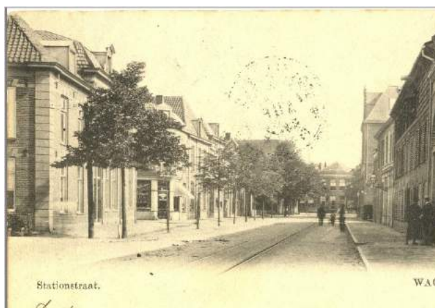
Stationsstraat in 1914

tijd dat de trein daar nog zijn eindstation had en de tram Arnhem-Rhenen daar voorbij kwam.