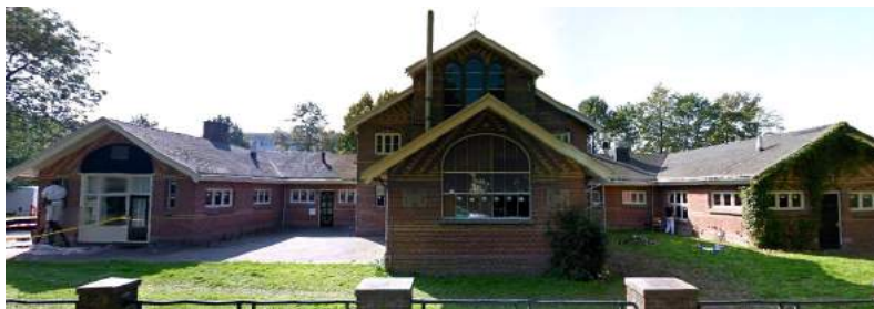
Gemeentelijk monument Duivendaal 7, locatie van onze algemene ledenvergadering op woensdag 22 juni 2016