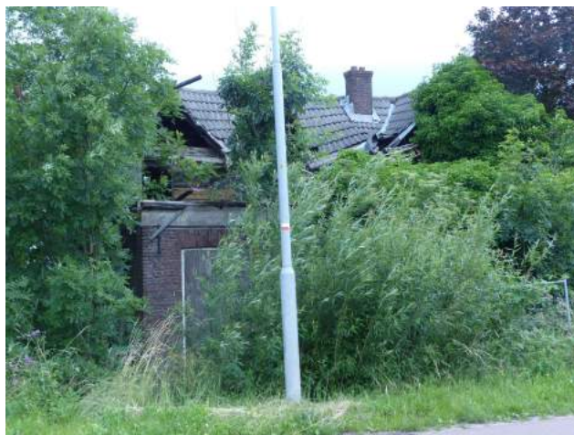
Huidige toestand van Rijksmonument Grebbedijk 6.....

er zo bij staat) wordt hier volgens de Monumentenwet een misdrijf gepleegd. Wij hebben alweer in 2008 aangifte gedaan van het plegen van dit misdrijf. Er gebeurde niets met de aangifte. Toen wij nog niet zo gek lang geleden eens informeerden bij het Openbaar Ministerie, kregen we te horen dat zij niet wilden vervolgen onder verwijzing naar de uitspraak van de Raad van State, waar nota bene werd bevestigd dat hier in strijd met de wet wordt gehandeld!