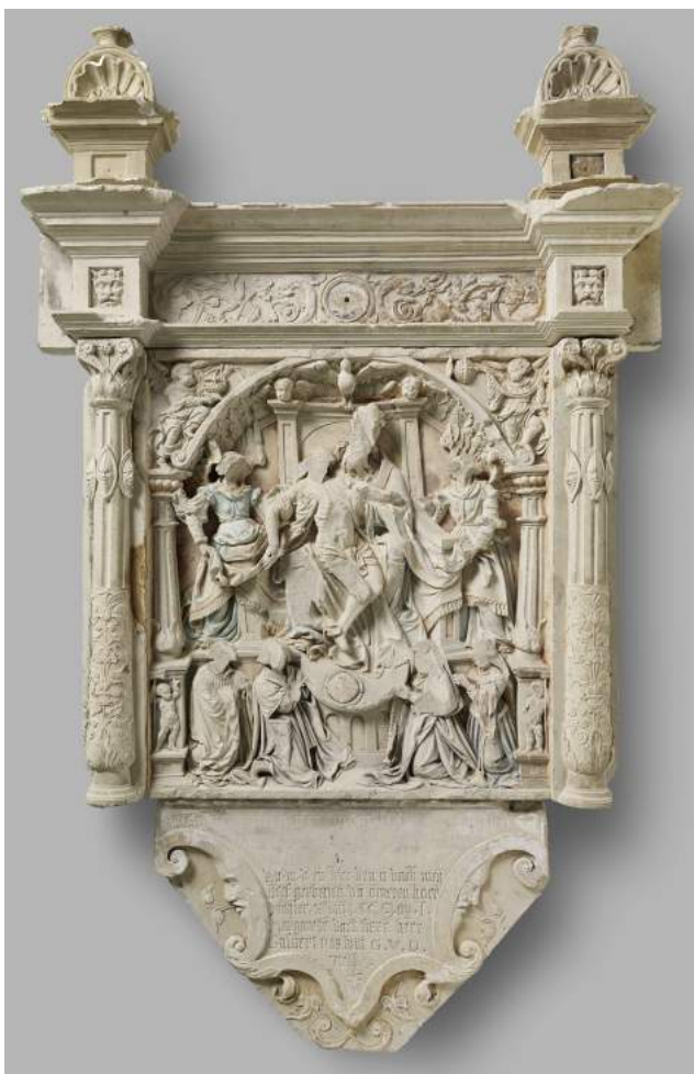
Het epitaf van de familie Ros