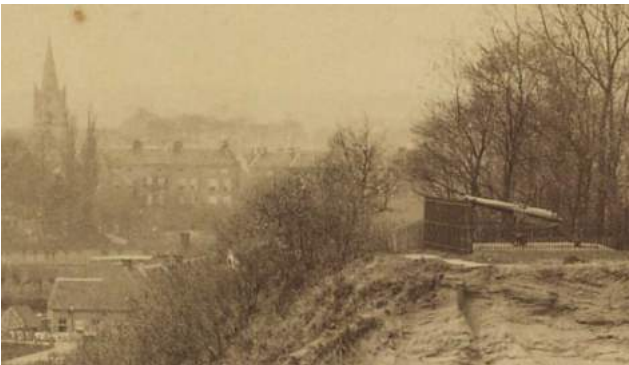
De seinpost aan de bergrand