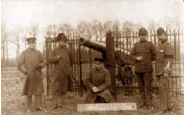
De bezetting van de seinpost in februari 1917