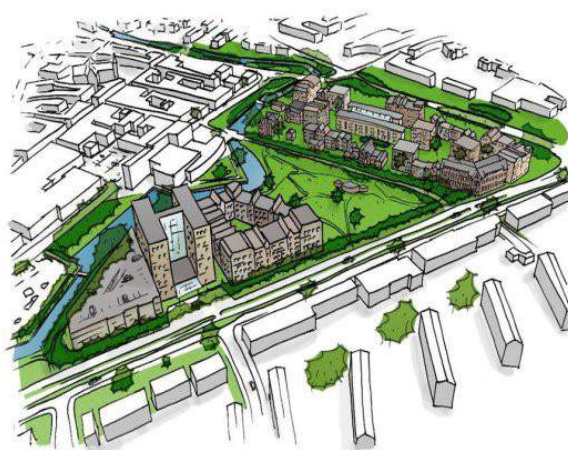
De plannen voor het Duivendaal en de Hof van Gelderland, juni 2014

Wageningen Monumentaal pleit voor het behoud van het volledige ensemble van eind 19e-eeuwse gebouwen op Duivendaal en voor het behoud van de ruime groene oevers aan deze zijde van de stadsgracht. De cultuurhistorische waarde van dit ensemble als eerste campus van Wageningen UR is onschatbaar. Duivendaal is een historische locatie met een eigen karakter, geen verlengstuk van het centrum.