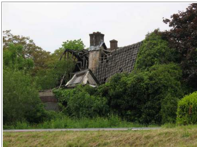
Grebbedijk 6, mei 2013, de natuur neemt bezit van een rijksmonument.....

De schandvlek aan de toegang tot Wageningen via de Grebbedijk is er nog steeds. Slechts weinig steden in Nederland hebben zo'n uniek pand binnen haar grenzen. Een rijksmonument, dat door onwillige eigenaren volledig aan zijn lot wordt overgelaten, binnen een gemeente waarvan het bestuur maar met de grootst mogelijke moeite kan worden overgehaald om tegen die verwaarlozing (een strafbaar feit) handhavend op te treden. Een dubbele schandvlek dus eigenlijk.