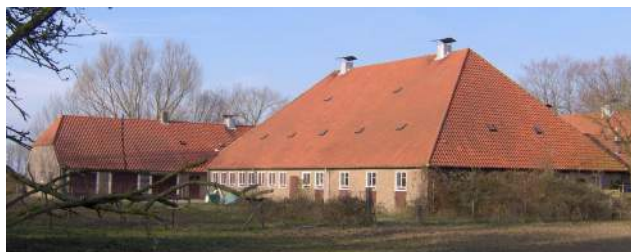
Rijksmonument Haarweg 12, locatie van onze jaarvergadering op donderdag 4 juni 2015