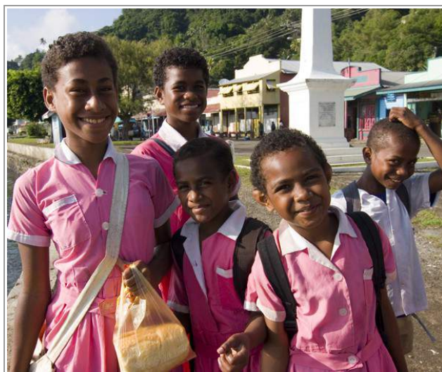
Tweemaal Fiji's erfgoed: koloniale gebouwen én vrolijke mensen!

Bescherming en beheer van gebouwd erfgoed staat in Fiji nog steeds in de kinderschoenen. Op het gebied van bouwhistorie en restauratie is er überhaupt weinig kennis.