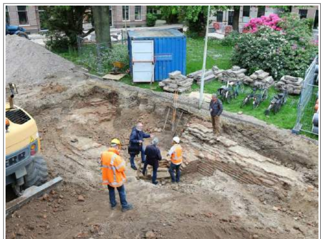
Toren en aanzet van de muur onder het plein

Bij dit werk, in Wageningen, hebben we het stadsbestuur gesuggereerd de teruggevonden contouren in het nieuwe plaveisel aan te geven. Die suggestie werd goed ontvangen. We wachten op de oplevering om te zien hoe dat gaat uitpakken.