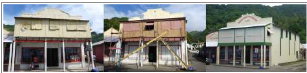
Prem Singh Building, van oud naar nieuw

In Suva zijn een aantal panden nu van een meer historisch verantwoord kleurenschema voorzien en op het moment begeleid ik de renovatie van de oude Town Hall van Levuka uit 1904.