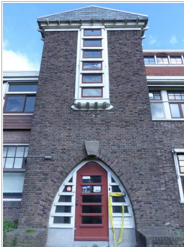
de voorgevel van het lab in huidige staat

Langs de weg naar Rhenen, even voorbij Nudenoord, staat het voormalige Laboratorium voor Plantenveredeling, een creatie, of eigenlijk een verbouwing, van de bekende architect Blaauw. Het pand staat al jaren leeg, maar eindelijk ziet het er naar uit dat de plannen om er appartementen in te ontwikkelen tot uitvoering gaan komen. Helaas zal de later toegevoegde lelijke dakuitbouw blijven bestaan. Toch is WM blij dat nu ook het vierde Amsterdamse School laboratorium van Wageningen een nieuwe invulling krijgt.