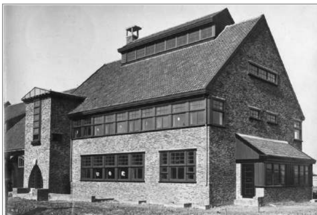
het lab in oorspronkelijke staat

Langs de weg naar Rhenen, even voorbij Nudenoord, staat het voormalige Laboratorium voor Plantenveredeling, een creatie, of eigenlijk een verbouwing, van de bekende architect Blaauw. Het pand staat al jaren leeg, maar eindelijk ziet het er naar uit dat de plannen om er appartementen in te ontwikkelen tot uitvoering gaan komen. Helaas zal de later toegevoegde lelijke dakuitbouw blijven bestaan. Toch is WM blij dat nu ook het vierde Amsterdamse School laboratorium van Wageningen een nieuwe invulling krijgt.