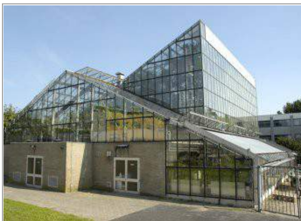
De tropisch kas in betere dagen