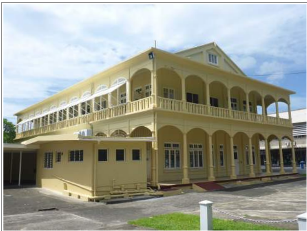
Fintel Building in Suva

erfgoedtoerisme te stimuleren. Een betere en snellere verbinding met bijvoorbeeld watervliegtuigjes zou een uitkomst kunnen bieden om het toeristisch ontwikkelde gebied in het westen met Suva en Levuka in het oosten te verbinden. Maar behoud van de gebouwen is een prioriteit.