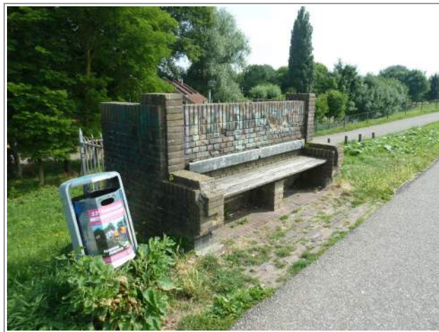
Bank op de Witte Sluis

Op de sluis in de Grebbedijk, ter hoogte van de Dijkstraat, staat een in de jaren '30 van de vorige eeuw gemetselde bakstenen bank. Wageningers van alle leeftijden zijn er dikwijls te vinden. Ook toeristen, wandelend of fietsend, houden daar vaak een stop. Helaas is de bank ten gevolge van slecht onderhoud niet het fraaie visitekaartje van Wageningen dat het aan deze toeristische route zou moeten en kunnen zijn. Graffiti, ontbrekende bakstenen, verweerde planken, openstaande voegen en mos ontsieren het beeld. Wageningen Monumentaal heeft in het verleden de slechte toestand van de bank bij de gemeente aangekaart, en daarop te horen gekregen dat het onderhoud zou berusten bij het Waterschap dat de sluis beheert.