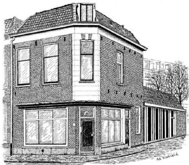
Stationsstraat 81 naar Ad Rietveld

van mening dat de pandjes behouden moeten blijven. Eigenaar is nog steeds de gemeente, en dat blijft voorlopig zo.