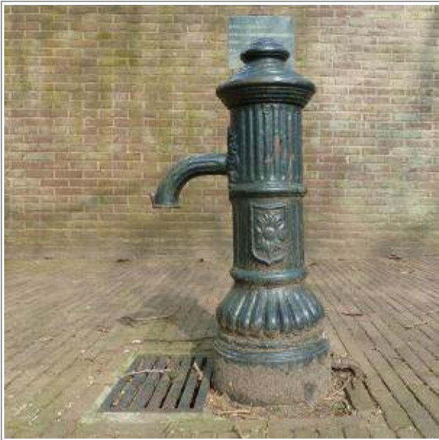
het pompje nog op zijn oude plek