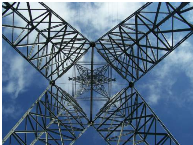
zeg nou zelf, dit is toch een kunstwerk

Mensen die op het internet hierover communiceren ( http://www.hoogspanningsforum.com ) zijn in ieder geval erg enthousiast over deze bijzondere masten, en fotograferen ze graag (we hebben de twee foto's van hen geleend). Het zijn ook min of meer kleine kunstwerken, die in beginsel niet onderdoen voor dat enorme voorbeeld: de Eiffeltoren.