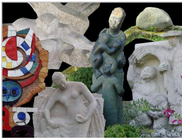
Collage van nog niet opgeloste raadsels....

Hoe anders ligt dit bij sommige andere kunstwerken die gevels in Wageningen hebben gesierd: De keramiektableau's op de