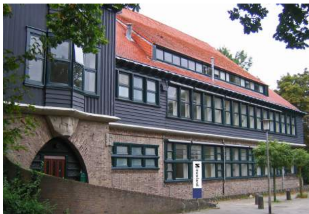
Gebouw microbiologie