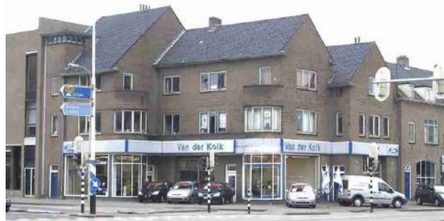
Van der Kolk, hoek stationstraat/Lawickse Allee

Reeds lang wordt gedacht over een beter(e) toegang naar en zicht op het centrum van Wageningen. Met name mensen van buiten die in Wageningen met de bus op de Stadsbrink aankomen vragen is dit het centrum.....?. Een veelomvattend plan door het architectenbureau BvR voor reorganisatie van het gebied Plantsoen / Stationsstraat/ Stadsbrink is als te ambitieus en te kostbaar terzijde gelegd. Als bijdrage aan de gedachtenvorming heeft Wageningen Monumentaal bij de gemeenteraadsleden ten behoeve van de commissievergadering van 23 maart 2009 een alternatief plan met bijbehorende schets ingediend. Het plan biedt een betere ontsluiting, betere zichtlijnen en een groter potentieel aan woningen en winkels.